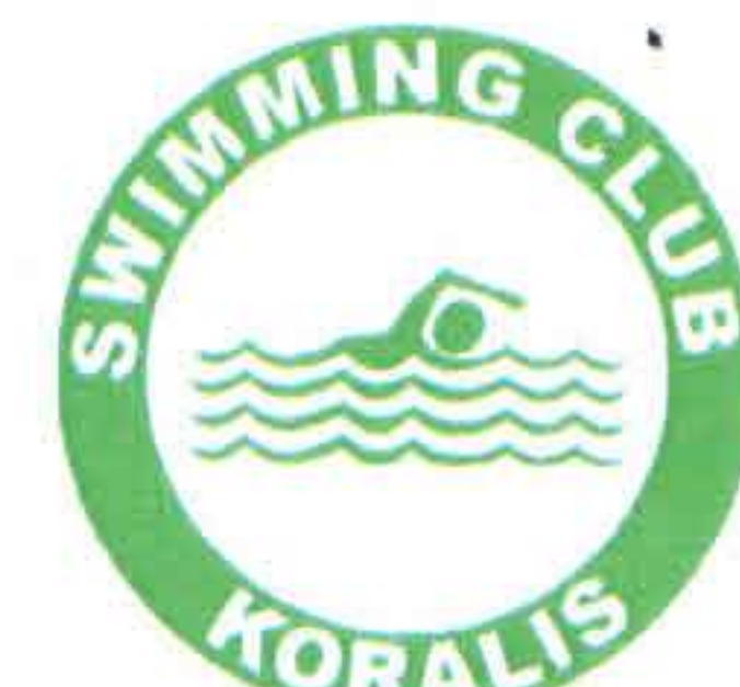
ALYTAUS PLAUKIMO KLUBAS „KORALIS“